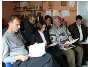
Osnivači Fondacije tuzlanske zajednice na Godišnjoj skupštini

Kao i slične lokalne fondacije u svijetu, Fondacija tuzlanske zajednice se specijalizovala da pomaže ljudima koji žele uložiti novac i vrijeme u opšte dobro društva. Mi smo prva fondacija za lokalni razvoj u Bosni i Hercegovini sa misijom da promoviramo kulturu darivanja i