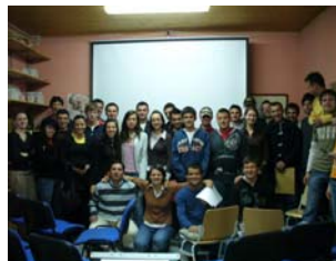
Odbor Omladinske banke, promocija odobrenih grantova

Obje Komisije savjesno i samostalno donose odluke o distribuciji malih grantova. Mali grantovi pomažu lokalnim organizacijama i građanskim