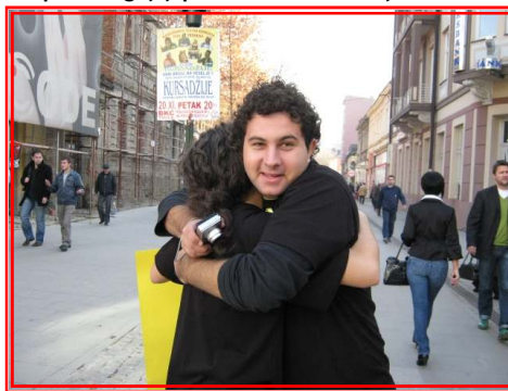
U nedostatku prolaznika grlili se volonteri :)