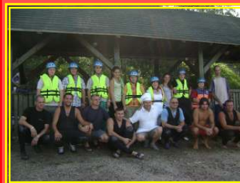
Priprema za plivanje