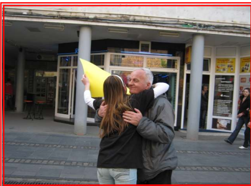
Malo se čudili, ali su ideju rado prihvalili :)

Zbog činjenice da je organizacija ovakvog događaja izazvala kod slučajnih prolaznika mnogo pozitivnog iznenađenja ali i osmijeha, Fondacija tuzlanske zajednice u saradnji sa Organizacijom za djecu i mlade Osmijeh za Osmijeh će učiniti ovu aktivnost tradicionalnom u našem gradu.