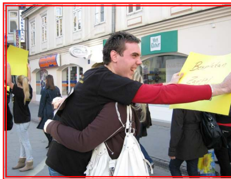
Besplatni zagrljaji prolaznike nisu ostavljali ravnodušnim