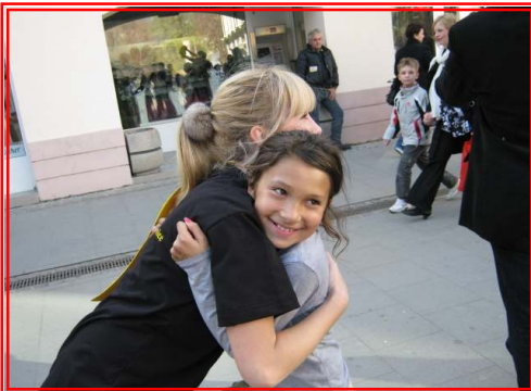
Najmlađi bez predrasuda