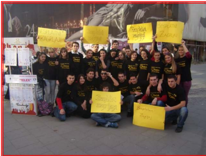
Fotografija za uspomenu volontera Fondacije tuzlanske zajednice

Na Svjetski dan djeteta, 20.11.2009. na šetalištu Korzo, Fondacija tuzlanske zajednice zajedno sa Organizacijom za djecu i mlade Osmijeh za Osmijeh, dram orkestrom OŠ Kreka i TTC Telex-om je organizovala obilježavanje ovog izuzetno značajnog datuma.